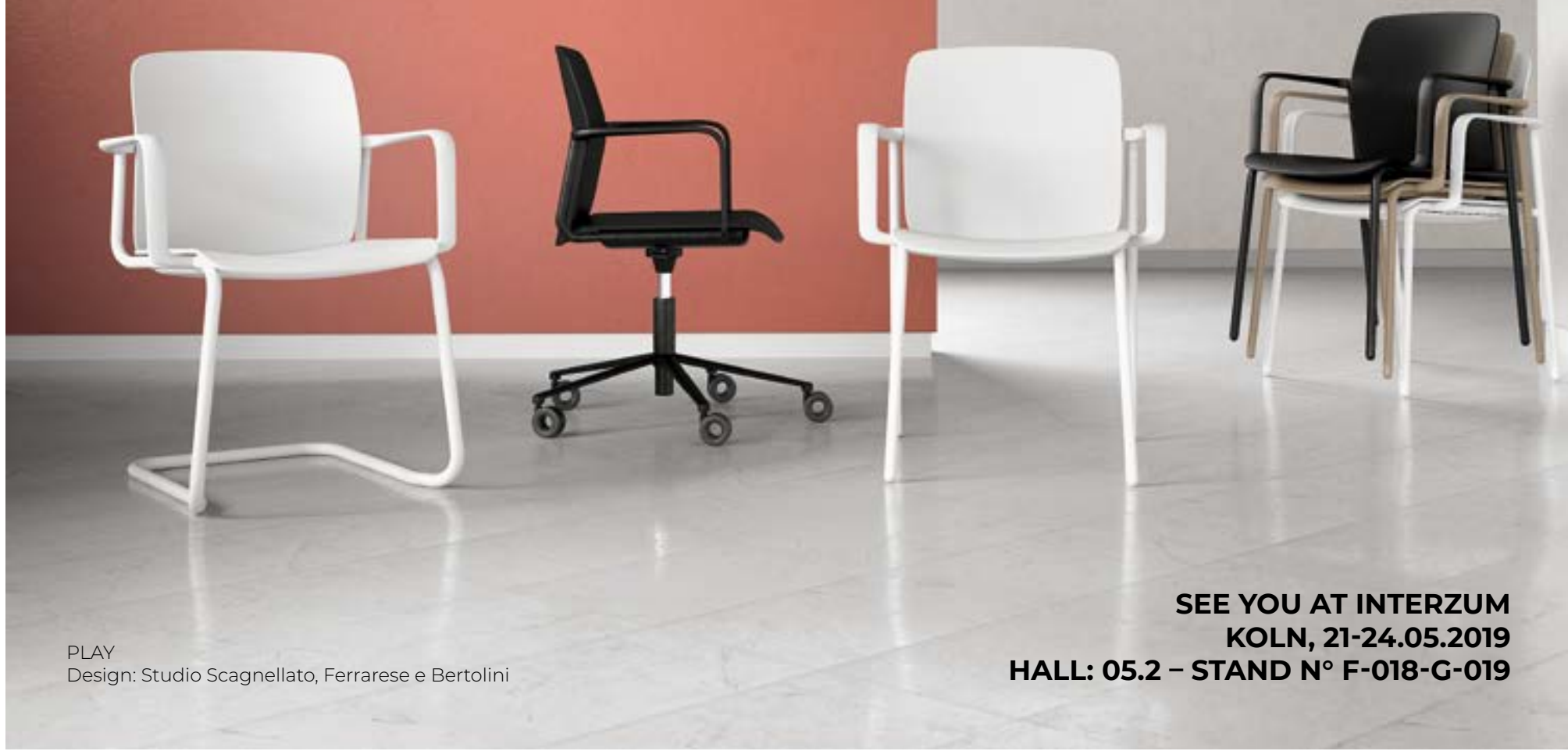
PLAY Design: Studio Scagnellato, Ferrarese e Bertolini

SEE YOU AT INTERZUM KOLN, 21-24.05.2019 HALL: 05.2 – STAND N° F-018-G-019