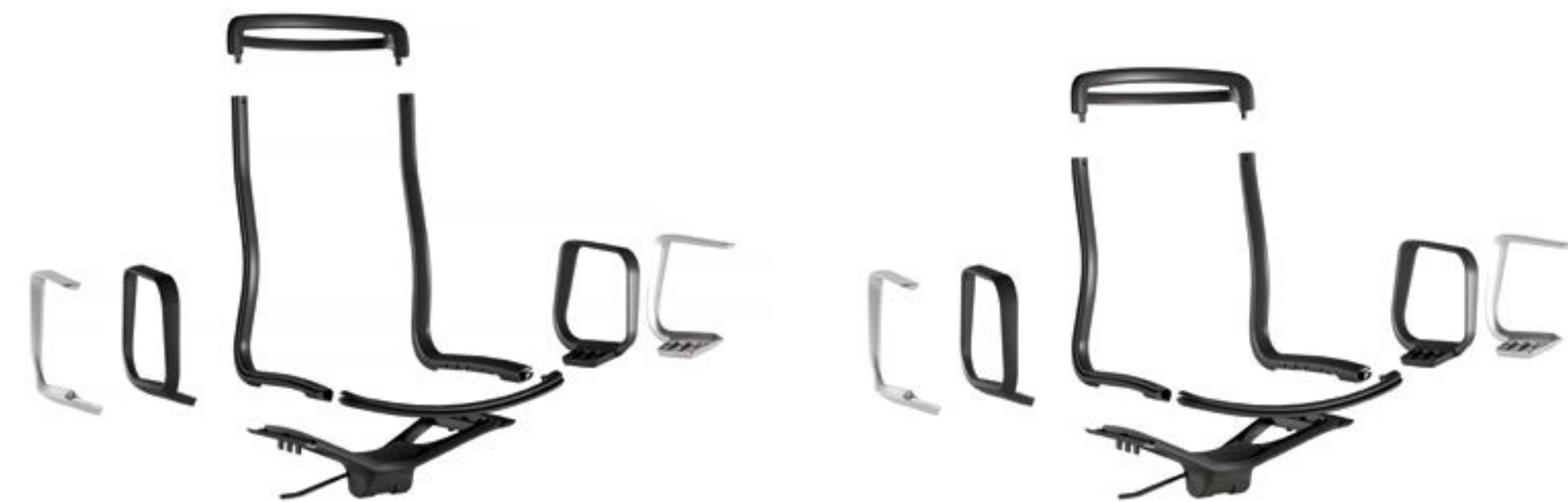
Schienale alto High back Respaldo alto

Rail es una silla operativa para light office, donde las actividades están listas para cambiar y ser compartidas rápidamente. Todos los componentes son de poliamida, mientras que el corazón tecnológico de la silla es un mecanismo de tilt simple y fiable. El asiento se hace particularmente cómodo por la malla termocontraíble. La familia se fabricará en las versiones alta y baja, sin brazos, con brazos de poliamida o con brazos de aluminio.